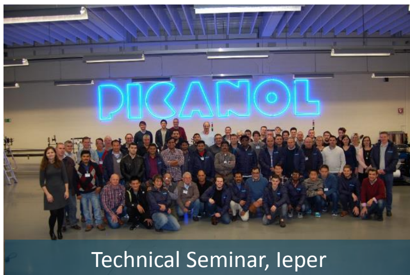
Technical Seminar, Ieper