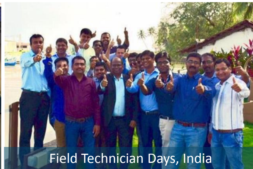
Field Technician Days, India