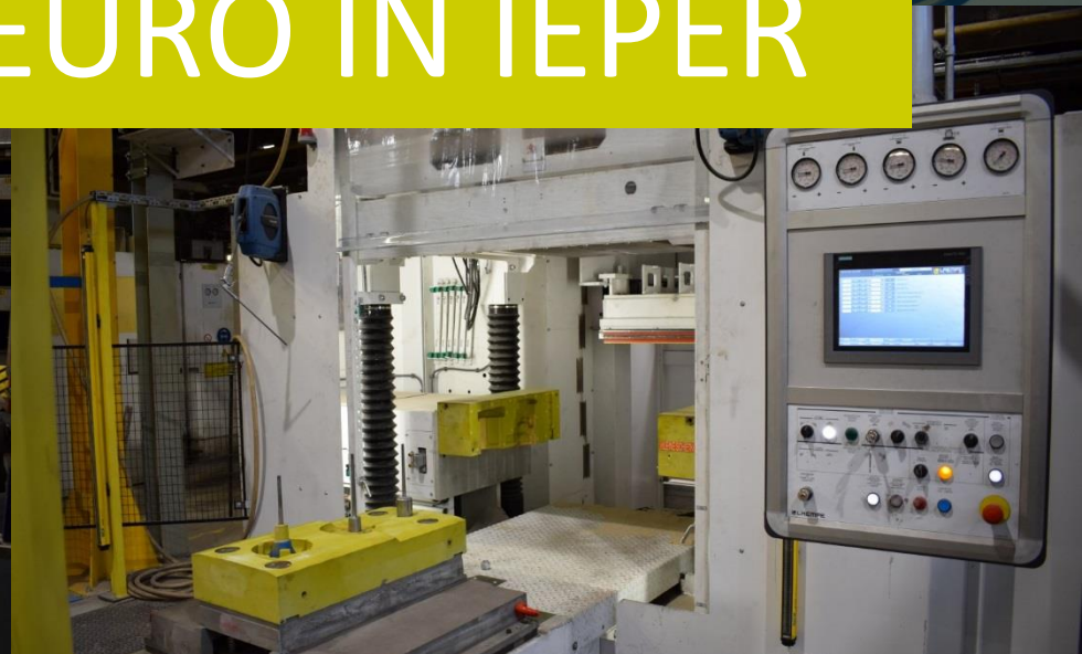
Nieuwe profielpolijstmachine Texmac