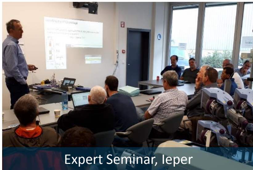
Expert Seminar, Ieper