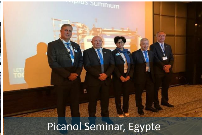
Picanol Seminar, Egypte